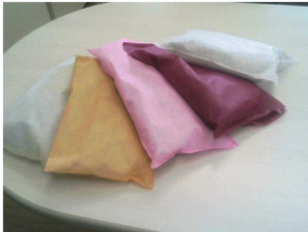
快適空間 部屋臭、タバコ臭、介護臭、ペット臭