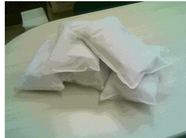
浄化 飲料水、料理水、料理油